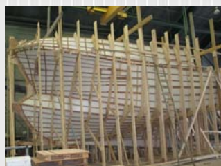
Moule de la coque