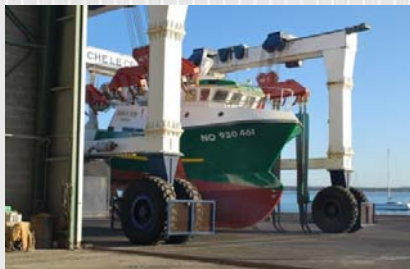
Mise à l'eau