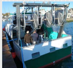
Portique aluminium et enrouleurs trois bobines